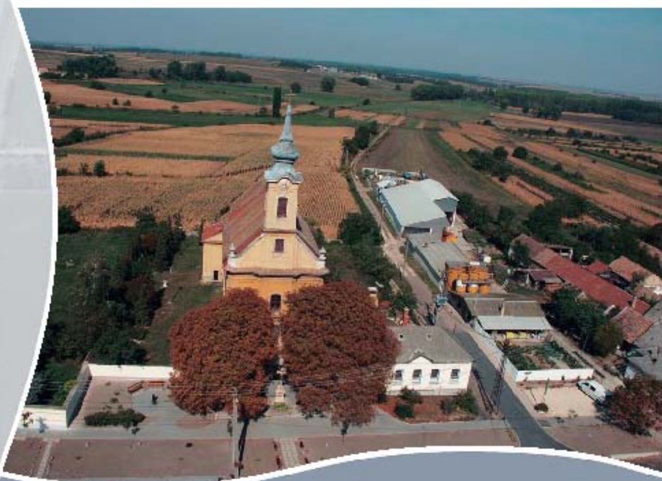
Bács, központ Zentrum, Bács Centre, Bács