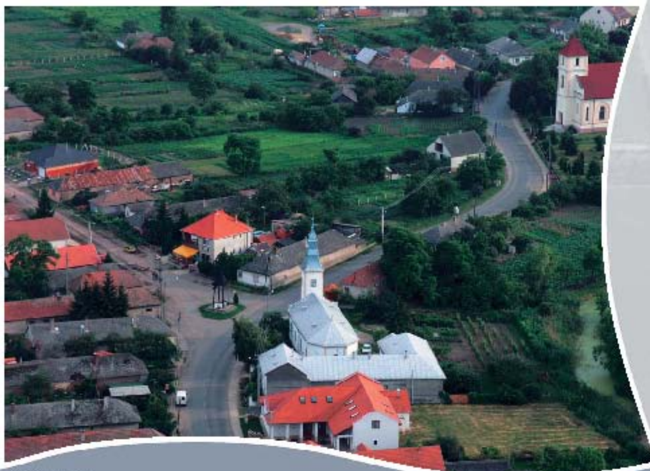
A szini malom Mühle in Szin Mill in Szin