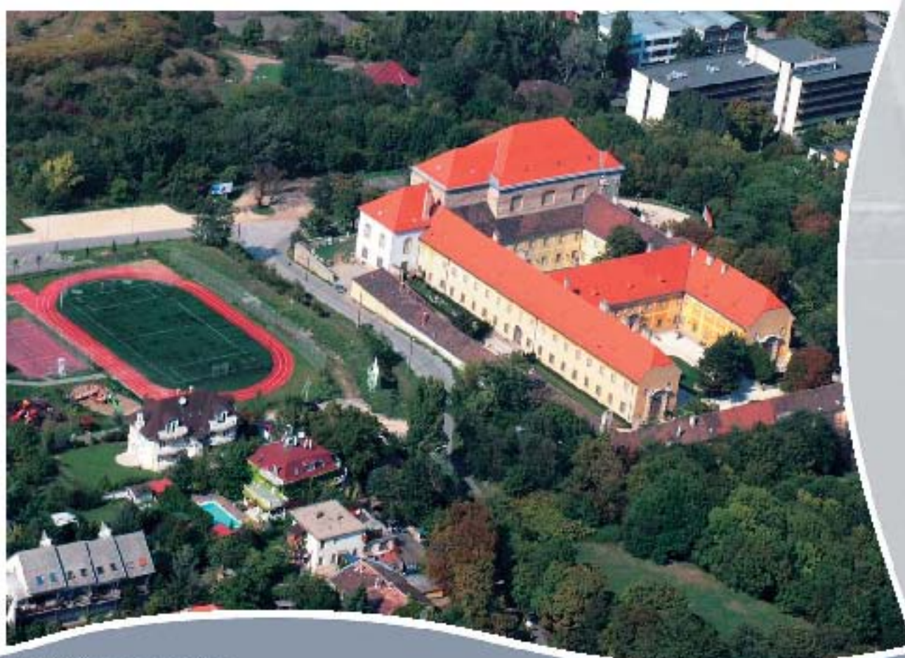
Budatény, kastélyszálló Schlosshotel, Budatény Castle hotel, Budatény