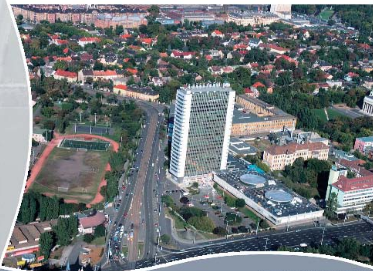
Budapest, Széchenyi fürdő Bad Széchenyi, Budapest Széchenyi Baths, Budapest