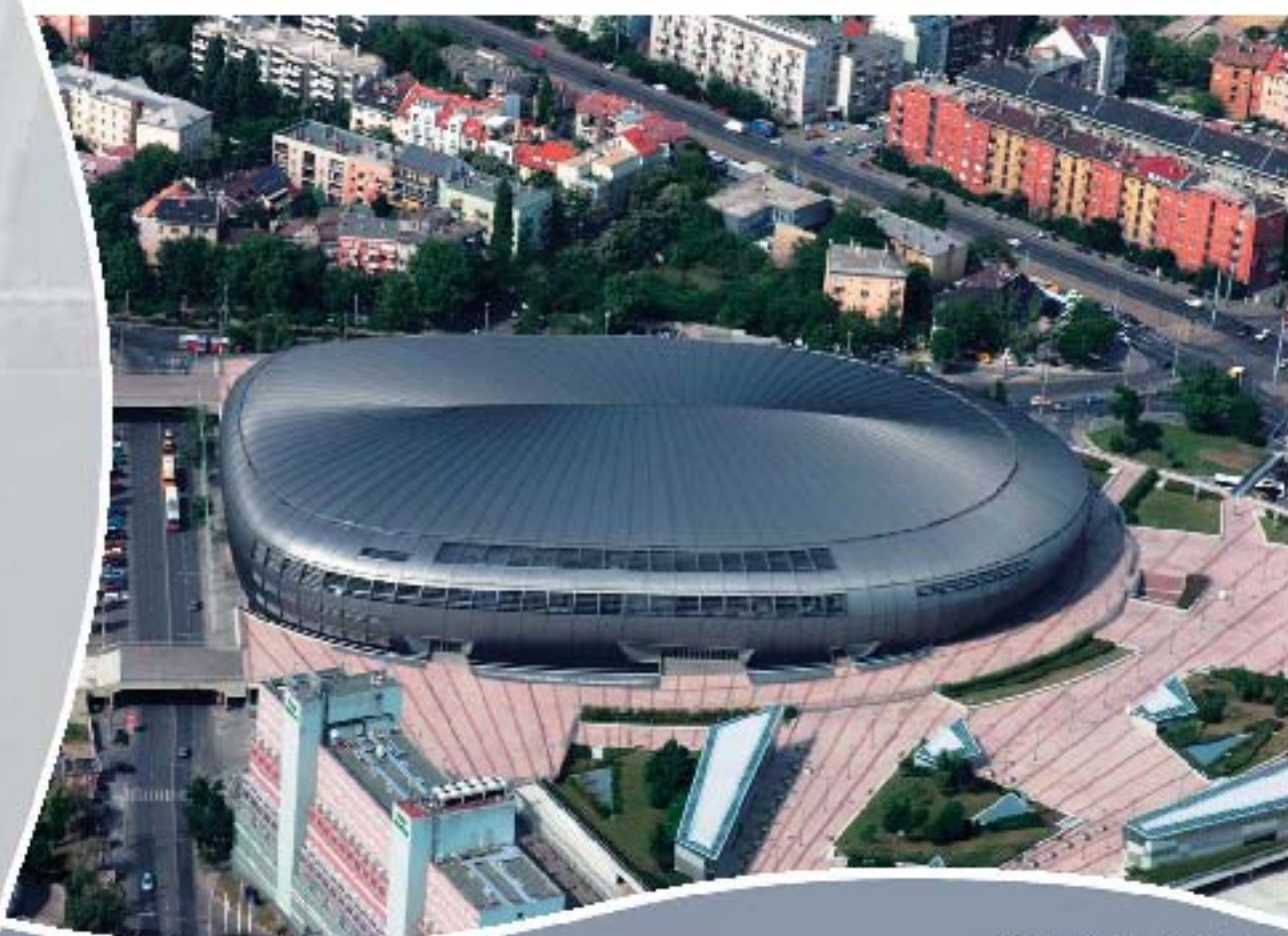
Budapest, Természettudományi Múzeum Museum für Naturwissenschaften, Budapest Natural History Museum, Budapest