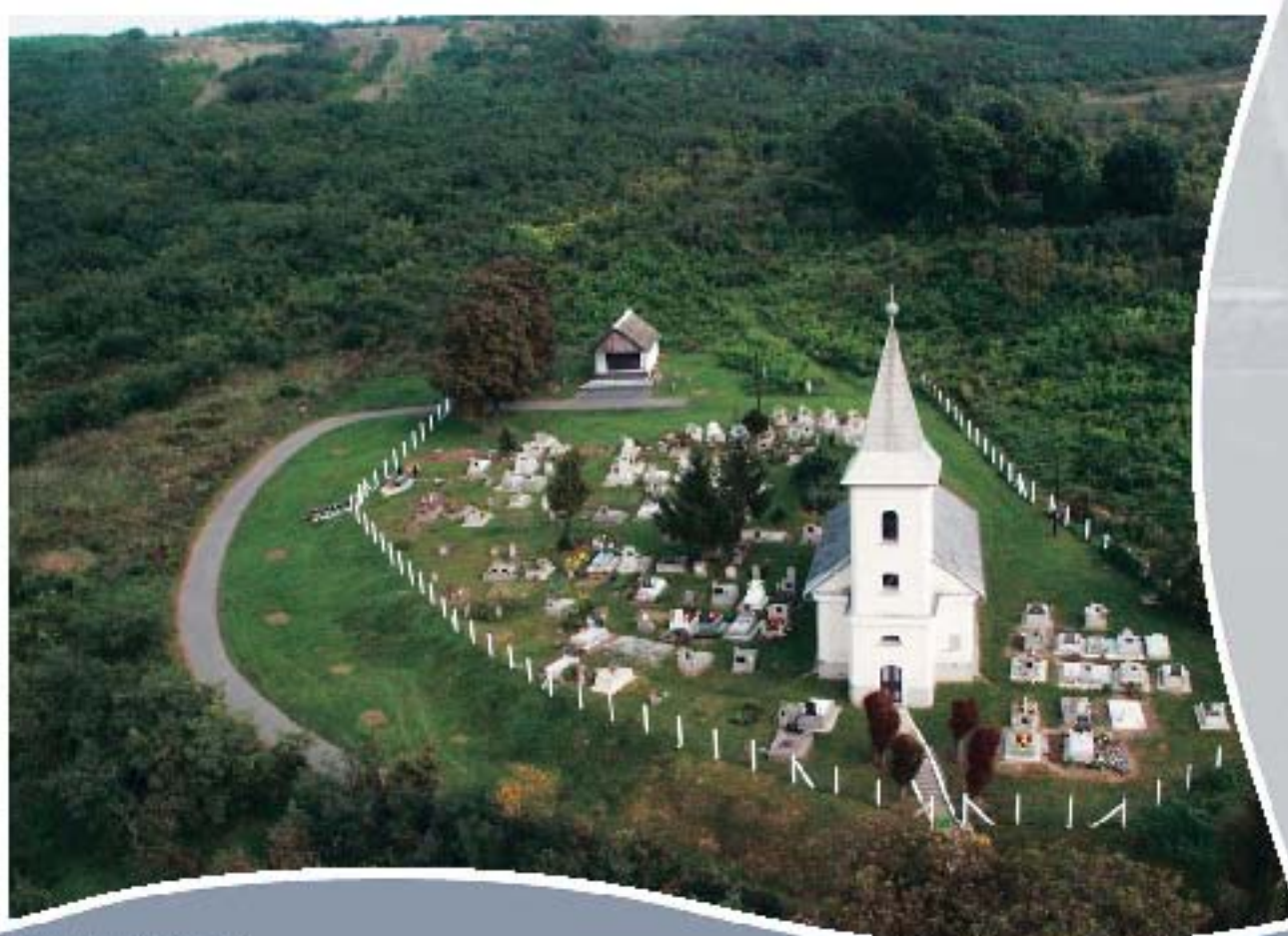
Bagamér, templom Kirche, Bagamér Church, Bagamér