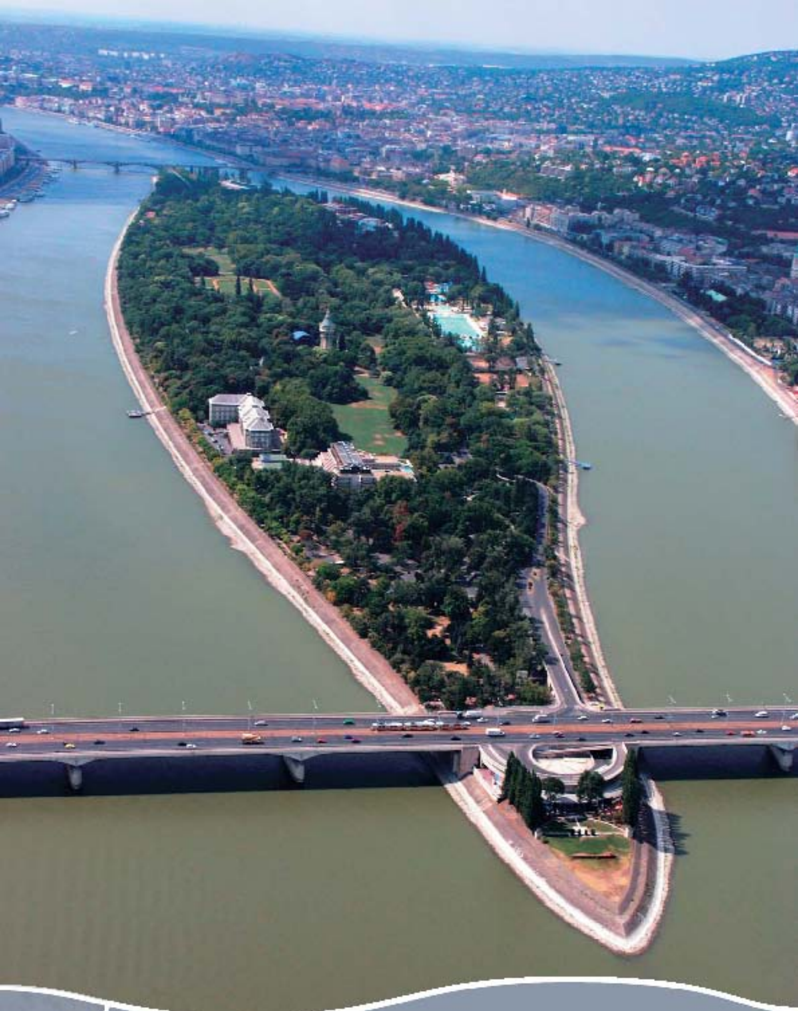
Budapest, Margitsziget Margareteninsel, Budapest Margaret Island, Budapest